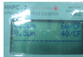
パーティクルカウンター