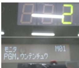
プログラム運転中